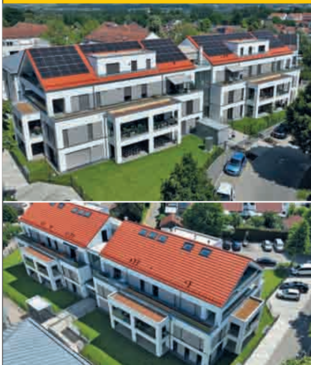
Göggingen - Donaustetten