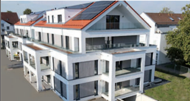
Göggingen - Donaustetten