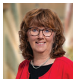
Stadträtin Sigrid Räkel-Rehner